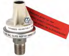
Sensor de presión alta