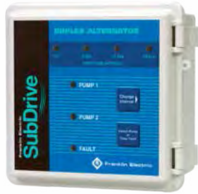
Alternador SubDrive Duplex