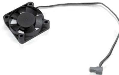
KIT de ventilador interno