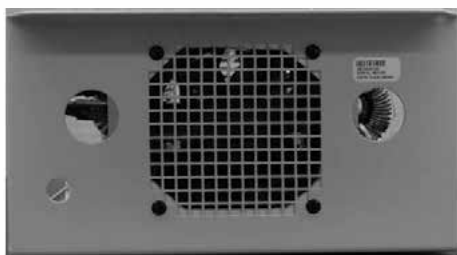
KIT de ventilador externo